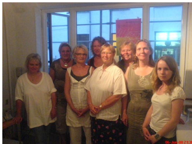
Fra den stiftende generalforsamling d. 6. juni 2008