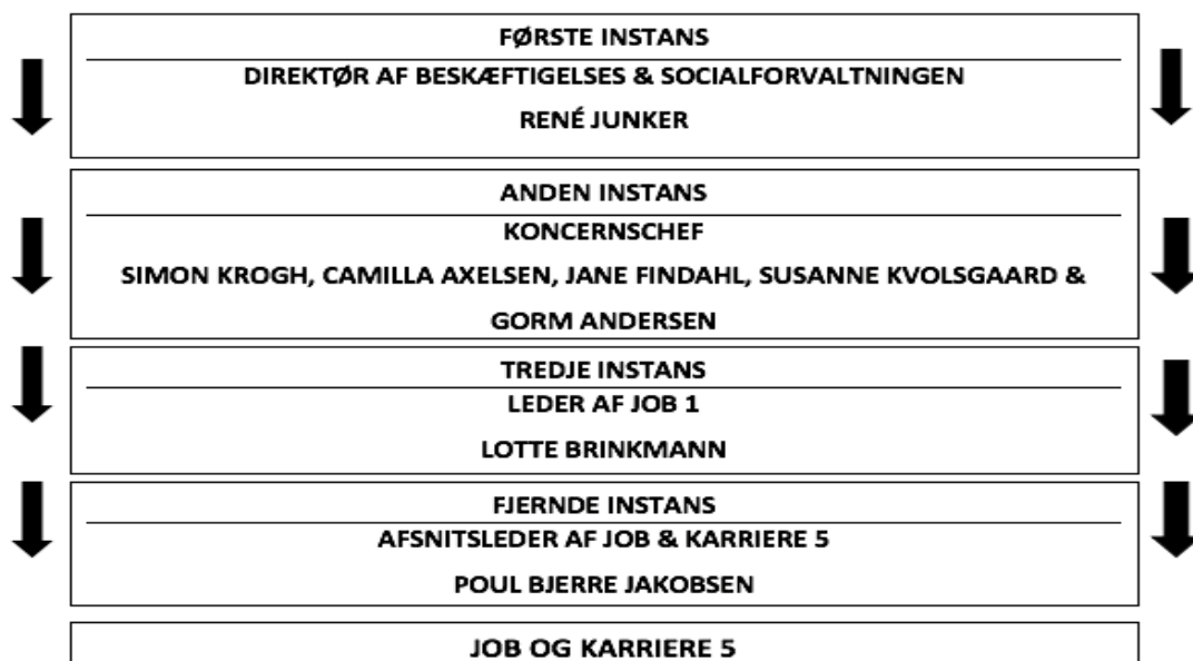
(Figur 3, Udarbejdet på baggrund af Odense kommunes organisationsdiagram, bilag 12)

Det første træk i Webers model af bureaukrati er: Hierarkisk struktur (Bakka & Fivelsdal, 2014, s. 50). Det kan ses, at Job og karriere 5 er præget af hierarkisk struktur, hvilket er fremvist i det nedenstående skema, der visualiserer det organisatoriske hierarki for Job & Karriere 5, og den top down-styring der finder sted.